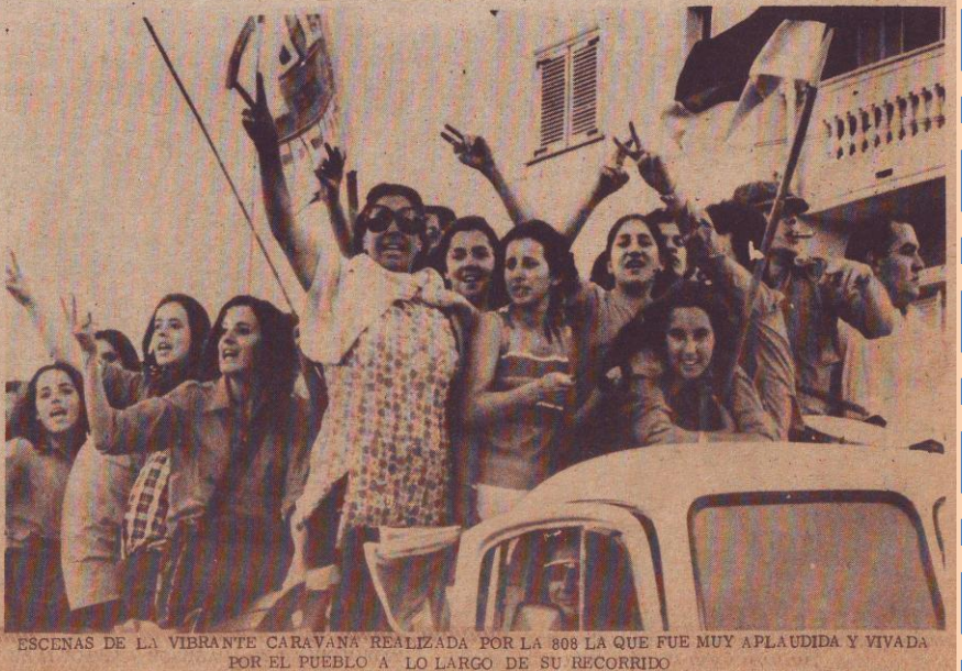
ESCENAS DE LA VIBRANTE CARAVANA REALIZADA POR LA 808 LA QUE FUE MUY APLAUDIDA Y VIVADA POR EL PUEBLO A LO LARGO DE SU RECORRIDO