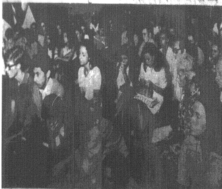
UN ASPECTO DE LA NUTRIDA CONCURRENCIA A LA CHARLA, QUE GOCIOTO GRAN INTERES POR LO RICA Y PROFUNDA QUE FUE LA PERSONALIDAD DE CAMILO